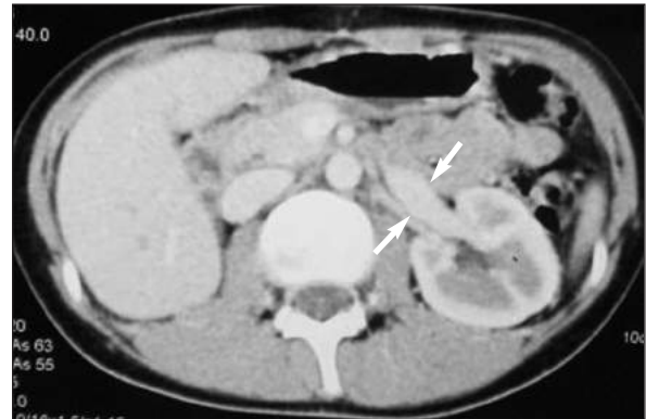
RESİM 2: BT'de transvers kesitte sol renal venin SMA ve abdominal aorta arasındaki dar alanın distalinde belirgin genişlemesi (iki ok arasında sol renal venin genişlemiş çapı) görülmektedir.

sol sürrenal, inferior mezenterik ven bağlanarak kesildi.