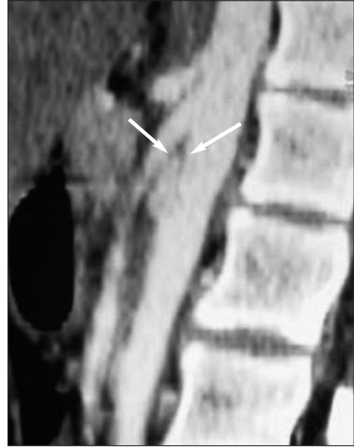
RESİM 1: Lateral kesit BT görüntüsünde SMA ve abdominal aorta arasındaki açının (ok işaretlerinin ucu) belirgin şekilde daraldığı görülmektedir.

Fizik muayenesinde genel durumu iyi, TA 100/60 mmHg, Nabızı 88/dk, solunum sesleri doğal, batın ve ürogenital sistem muayenesinde anlamlı bulgu yoktu. Hastanın 24 saatlik idrarında 350 mg/gün (N<150 mg) protein saptanması haricinde rutin biyokimya, üre, kreatinin ve hemogram tetkikleri normal sınırlar dahilindeydi. Hastanın soy geçmişinde özellik bulunmamaktaydı. Hastaya ve ebeveynine gerekli bilgiler verildikten sonra ebeveyninden "bilgilendirilmiş olur" alındı. Preoperatif hazırlıklarını takiben hastaya genel anestezi altında göbek üstü göbek altı median insizyon yapılarak, cilt cilt-altı geçildikten sonra batına girildi. Periton geçildikten sonra retroperitona ulaşıldı. Sol renal ven eksplore edildi, ileri derecede dilate olduğu görüldü (Resim 3). Vena kava inferiyor (VKİ) eksplore edildi, serbestleştirildi. Sol ovarian,