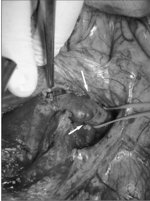
RESİM 3: Basının distalinde genişlemiş sol renal venin görüntüsü.

NCS nadir görülen bir durumdur. Sol yan ağrısı ve pelvik venöz konjesyon, proteinüri semptomları olan hastalarda dikkatli bir fizik muayeneyi takiben istenen Renkli Doppler Ultrasonografi (RDUS), BT, MRI gibi radyolojik tetkikler NCS'de düşünülerek değerlendirilmelidir. Semptomların ilerlemesi veya ciddiyeti girişim zamanını belirlemede en önemli unsurlardır. Asemptomatik erişkin ve çocuk hastalar en az 2 yıl semptom ve bulgular için takip edilebilir. Özellikle çocuklarda büyüme ile birlikte anatomik bozukluğun düzelebileceği gösterilmiştir. Genellikle ilk başvuru non-invaziv tanı yöntemi duyarlılığı %78, özgüllüğü %100'e yakın olan RDUS olmaktadır. Renal vende darlık öncesi ve sonrasındaki PSV oranının 4.2'den, ön-arka çap oranının 4.0'den fazla olması tedavisinin başarısı açısından önemli bir göstergedir. Kesin tanı