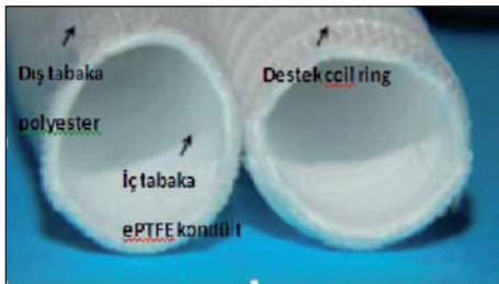
RESİM 1: Fusion ringli ve ringsiz vasküler greft.

Günümüzde halen ideal bir bypass grefti mevcut değildir ve geliştirilen farklı özellikteki greft materyalleri ile bypass ameliyatları uygulanmaktadır. Kliniğimizde de son dönemde uygun SVG bulunamadığı infrainguinal femoropopliteal bypass operasyonlarında çok katmanlı (örgü polyester tekstil kaplı) hibrid ePTFE vasküler greft (FUSION Vascular Graft, MAQUET, ABD) (Resim 1) kullanılmaktadır. Literatürde, bu greftin periferik arte-